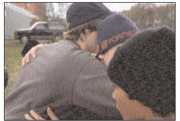
INGEN BØNN: Klassekompisene får en siste klem før bilen kjører til flyplassen. De har kjent hverandre i fire år og spilt på samme fotballag.